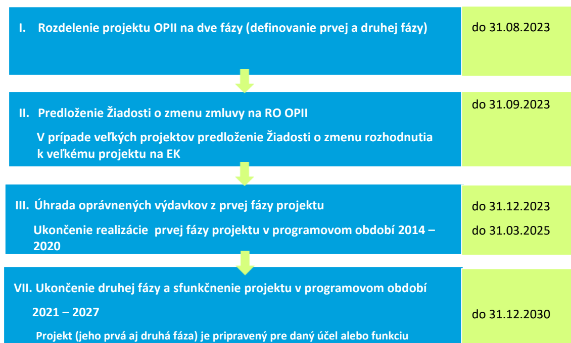
Schéma 1 Proces fázovania projektov (schválené projekty)